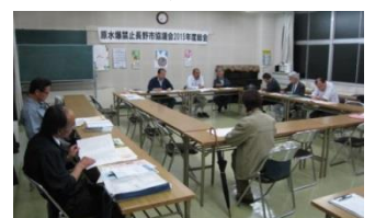
長野市原水協総会(6月5日 高校会館中会議室)

討論では、各組織から、「平和進行や世界大会へみんなで参加し、署名もより多く集め、核兵器廃絶へのとりくみを積極的に進める」と、核兵器廃絶を求める運動への力強い決意が語られました。