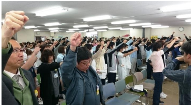
会場にマスコミの取材(写真右端)も入りニュースで報道されました。

長野地域民医連労働組合は、春闘要求に対するベアゼロ、定期昇給のみという回答を受け、3月17日、長野中央病院と老健施設ふるさとの2会場で29分間