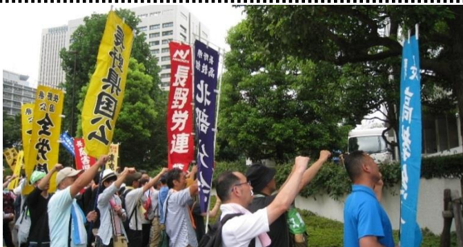
写真上…総決起集会 左…厚労省・人事院前要 求行動 右…銀座デモへ